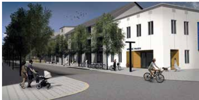
Pohled na budoucí služebnu městské policie od rohu ul. Těšinské a TGM

Rekonstrukce by měla přijít na cca 63 milionů korun a měla