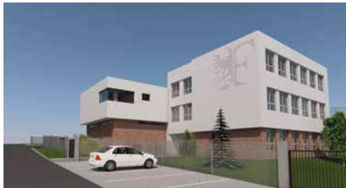
Vizualizace | MM F-M

Jednotka dobrovolných hasičů ve Střelniční ulici se specializuje