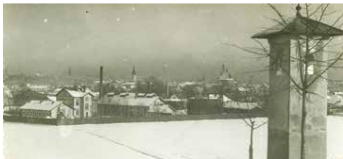
Pohled na Elzerovu cihelnu, 20. léta 20. století.