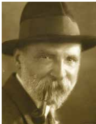
S. K. Neumann

Stanislav Kostka Neumann byl novinář, básník, divadelní i výtvarný kritik, překladatel z francouzštiny a ruštiny. Narodil se v Praze do rodiny advokáta 5. června 1875. Studia na gymnáziu nedokončil a nastoupil jako lokálkař do deníku Nový hlas. Od mládí se účastnil politického života: od anarchistického hnutí Omladiny, kdy byl za svou činnost několik měsíců vězněn, se dostal do komunistické strany, kterou ale v roce 1929 opustil a tím utlumil svou politickou kariéru. V jeho tvorbě se promítly vlivy dekadentní a naturistické, stal se jedním z průkopníků proletářské poezie. První sbírku Nemesis, bonorum custos vydal v roce 1895. Z období 1. světové války jsou známé sbírky Kniha lesů, vod a strání a Nové zpěvy, poslední sbírky vznikly v době okupace (Bezedný rok, Zamořená léta). Zajímal se o knižní grafiku a bibliofilii, stál