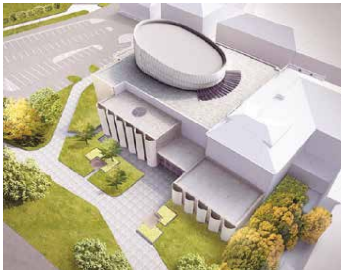
Vizualizace projektu Nové scény podle návrhu architektky Evy Jiříčné.

V případě, že Žilina titul získá, stane se Frýdek-Místek součástí projektu a bude na svém území realizovat kulturní a rozvojové projekty s evropským rozměrem a podporující mezinárodní spolupráci. Díky spolukandidatuře se Frýdku-Místku otevřela cesta k vytvoření kulturního centra, které vznikne rekonstrukcí a propojením Národního domu, Moravia Banky a stavby Nové scény podle návrhu architektky Evy Jiříčné se sálem pro 450 diváků. Všechny tři objekty vytvoří jeden funkční celek. V zrekonstruované Moravia