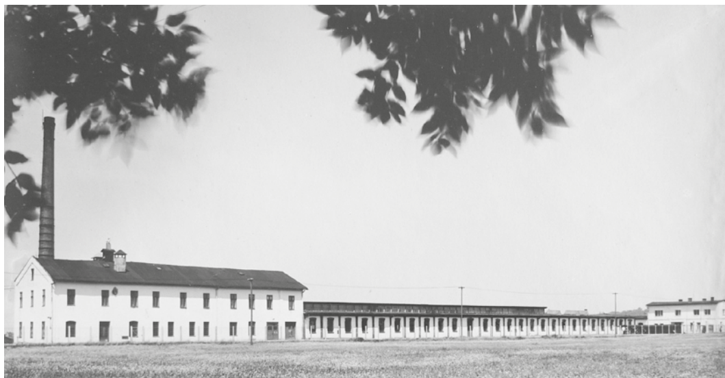
Geiringerova textilní továrna

Při výjezdu z Frýdku-Místku na dálnici ve směru na Ostravu se po pravé straně nachází areál Technických služeb. Málokdo však ví, že se v těchto místech již od 80. let 19. století nacházela malá tkalcovna s 24 stavy. V roce 1886 ji vybudovali dva místečtí měšťané Mořic Latzina a Josef Schwartz. V následujícím roce se stal jediným majitelem Latzina, tkalcovnu zvýšil o jedno patro a počet stavů rozšířil na 36 stavů. Přistavěl rovněž kotelnu a strojovnu, aby tkalcovské stavy mohly být poháněny parním strojem. Již v roce 1889 koupil podnik Arnošt Zweig, dlouho se ale ze svého štěstí netěšil, v roce 1893 se jeho firma dostala do konkurzu a tkalcovnu koupil Eduard Paneth. Ten postavil nový sál na tkalcovské stavy a továrnu rozšířil o přibližně dalších 300 stavů, vybudoval také novou kotelnu, strojovnu a přípravnu. V roce 1907 svůj podnik