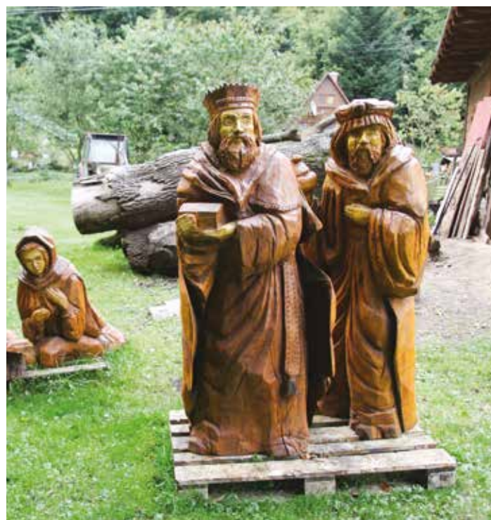
Postavy králů budou ozdobou betlému v Říčanech.