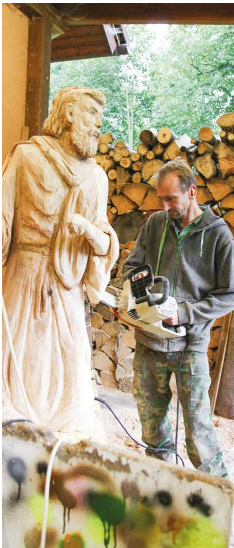
Motorová pila má na výrobě nové sochy devadesátiprocentní podíl.

I když máme otevřeno celoročně, samotný provoz galerie by mě neuživil. Značná část mé práce je tak tvořena na zakázku a moje sochy mají už předem daného majitele. Jsem ale rád, když se stávají součástí veřejného prostoru. Nedávno jsem dokončil Krakonoše do