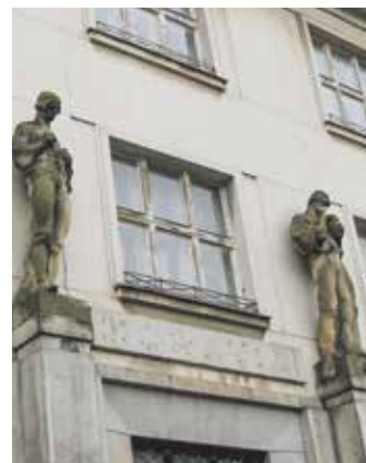
Z průčelí bývalého sídla Moravia banky už zmizel její název.

Jedná se o první krok na cestě k nové éře objektu někdejší Národní záložny místecké. Po neblahé epizodě z 90. let se budova vrátí lidem v rámci vzniku nového kulturního centra. Dostane důstojné využití, bude v ní městská galerie. Písmena si lidé budou moci pořídit v chystané veřejné dražbě, jejíž výtěžek půjde na charitativní účely. ■