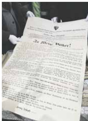
Tubus s dokumenty obsahoval také provolání císaře Františka Josefa I. „Mým národům“.

Některé materiály vyvolávaly v přihlížejících před největším místeckým chrámem konkrétní vzpomínky. Jedna přítomná paní si vzpomněla, že osobně znala tehdejšího klempíře, o němž se v tubusu nacházely podrobnější informace. Všechny nalezené materiály farnost spolu s památkáři