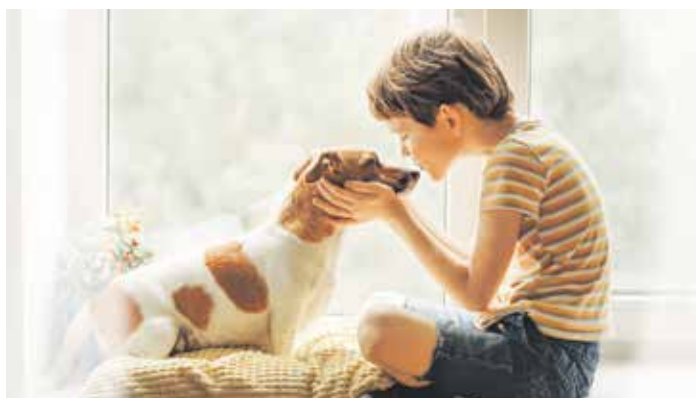
Město přistoupilo ke snížení poplatků za psy.

Výrazně však ušetří majitelé psů, zatímco vloni vlastník psa v bytovém domě zaplatil 1 500 Kč (za každého dalšího psa pak 2 250 Kč), od letošního roku je výše poplatku snížena na 900 Kč (za každého dalšího psa 1 200 Kč). Poplatek za psa v rodinném domě v katastru Frýdku-Místku činí 500 Kč místo dosavadních 700 Kč (cena za druhého psa se sníží ze 1 050 Kč na 500 Kč). Poplatek za psa v rodinných domech v městských částech Lískovec, Panské Nové Dvory, Lysůvky, Chlebovice a Skalice se sníží o stokorunu na