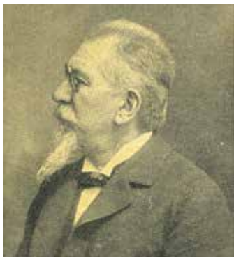
Básník Adolf Heyduk

Básník Adolf Heyduk se narodil 6. června 1835 v rodině truhláře a hostinského v Rychmburku (Předhradí) na Chrudimsku.