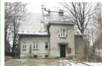
Vilku na ul. Národních mučedníků získalo v dražbě Krevní centrum.

Vilku po bývalé školní družině v ul. Národních mučedníků získalo v licitaci Krevní centrum. Z osmi zájemců tato společnost podala nejvyšší nabídku 5 910 000 korun. Budovu nyní plánuje opravit a následně využít jako skladové prostory. Téměř pětáosmdesát let starou vilku využívaly ještě nedávno děti ze ZŠ Petra Bezruče jako družinu. Kupní smlouvu s vylicitovanou částkou musí ještě schválit zastupitelstvo města. ■