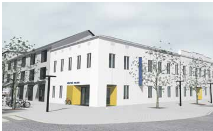
Bývalé textilní učiliště na Těšínské ulici se promění ve služebnu městské policie.

Stavební úpravy se dotknou celého částečně podsklepeného objektu a nejbližšího okolního terénu. Dojde k výměně střešní konstrukce a krytiny, oken a dveří i celkovému zateplení. Úpravami projdou také inženýrské sítě. Rekonstrukce vyjde na cca 62 milionů korun, z nichž zhruba polovinu uhradí státní dotace a dalších osmnáct milionů korun město